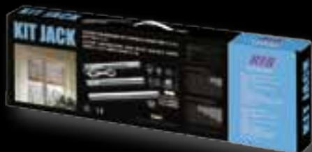
KIT JACK 30 SS AD00301 KIT JACK 60 SS AD00303