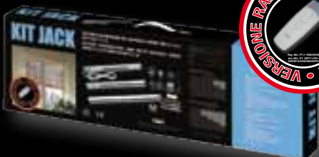
KIT JACK RADIO 30 SS AD00302 KIT JACK RADIO 60 SS AD00304